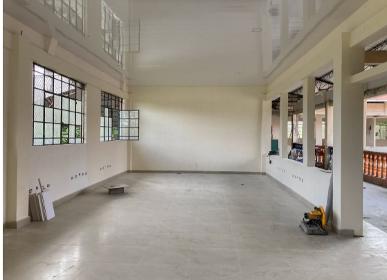
Una de las salas de enfermería