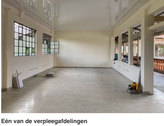
Eén van de verpleegafdelingen