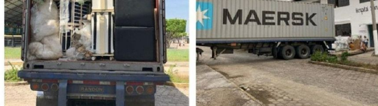
Van Den Haag ...