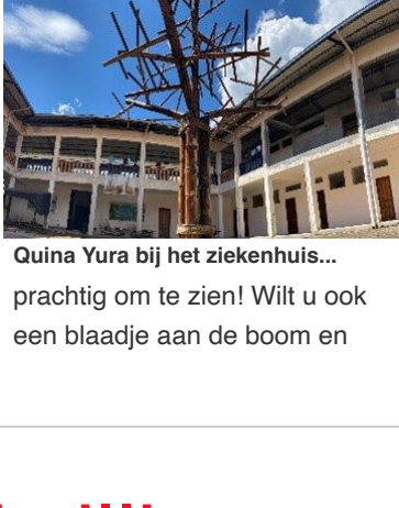
Quina Yura bij het ziekenhuis...

In 2021 werd door lokale kunstenaar Ricardo Salazar een boom gemaakt in het midden van de binnenplaats van het ziekenhuis: Quina Yura. Het is mogelijk met een eenmalige donatie een blaadje te kopen voor aan deze donatieboom of een blaadje te krijgen door periodiek te doneren. Inmiddels is de boom al flink gevuld,