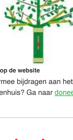
...en op de website

prachtig om te zien! Wilt u ook een blaadje aan de boom en